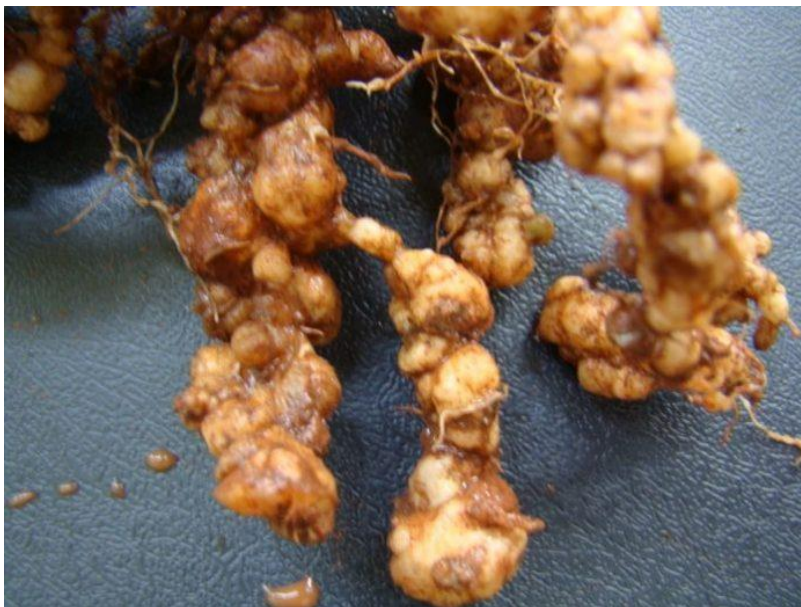
Figura 1. Galhas de nematoides em soja ( Glycine max ).

Os fungos, conhecidos como nematófagos podem ser divididos em três grupos principais: endoparasitas, predadores e parasitas de ovos (SOARES; SUFIATE; QUEIROZ, 2018).