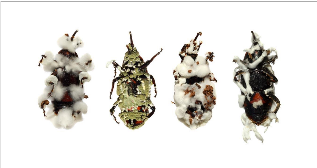
Figura 3. Mecanismo de esporulação externamente ao cadáver do inseto.

Nos últimos tempos, foi descrita a interação endofítica de fungos entomopatogênicos com plantas, em que os fungos são vistos colonizando raízes e outras partes das plantas, sem sintomas ou danos físicos evidentes. Linhagens de Beauveria